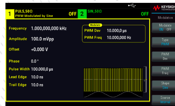
標準内蔵の正弦波で変調されたPWM信号