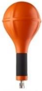
E & H (1Hz - 400KHz)