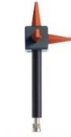
E (Mobile & WiFi)