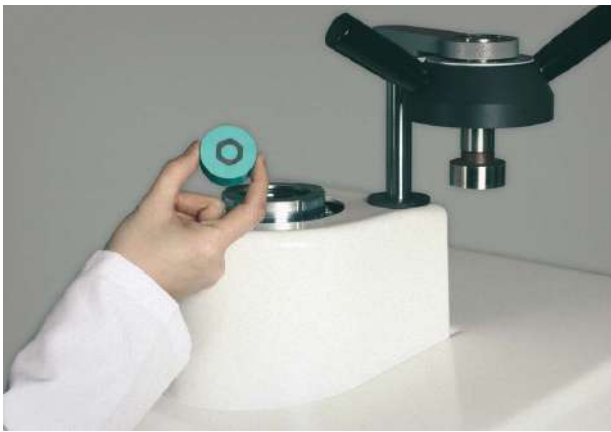
再現性のある埋込