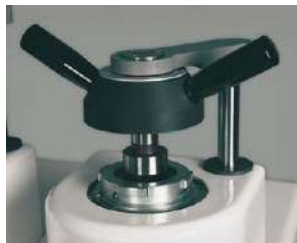
バイオネット式クロージャ