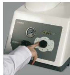
操作パネル ECOPRESS 52