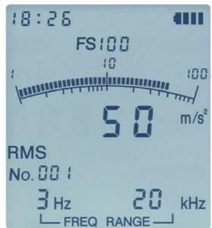
バックライトの点灯