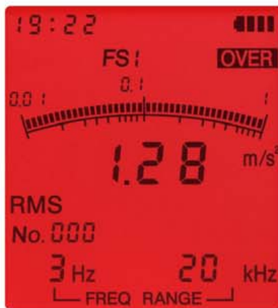
オーバーロード画面