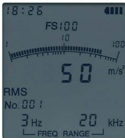
測定データの表示画面

液晶画面にはバググラフと数値が同時に表示され、変動の様子を容易に把握。設定した周波数範囲などの情報も表示し、バックライト機能により暗所でも内容を確認できます。オーバーロードの状態になると、OVERが表示され、液晶全体が赤色に変わります。