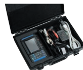
携帯用ケース 9782 オプション収納可能、樹脂外装