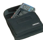
ソフトケース 9812 小物収納可能、ネオブレングム