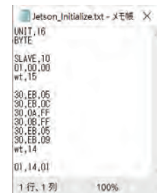
I2C 設定スクリプト例