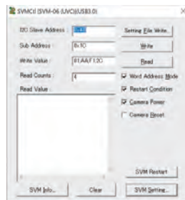
I2C 制御アプリケーション SVMCI