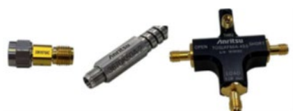
CALキット、テストポートケーブルなど