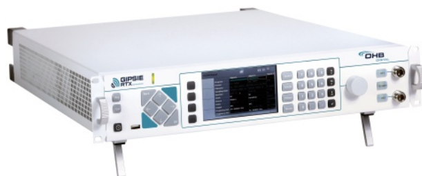
XPLORA信号生成ハードウェア

非常に詳細な信号シミュレーションを使用して、干渉とスプーフィングの対策と緩和戦略を改善します。