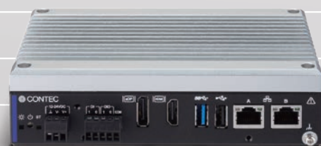
NVIDIA® Jetson Xavier™ NX 搭載 DX-U1200-3E0211 DX-U1210-3E0211 簡易防塵モデル