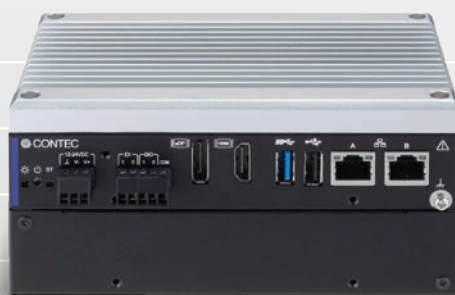
NVIDIA® Jetson Xavier™ NX 搭載 DX-U1200P1-3E0211 拡張スロットモデル