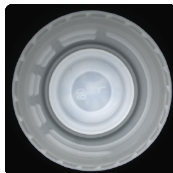
ペットボトルのキャップ