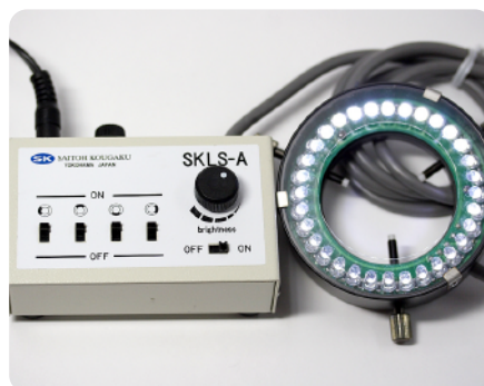
LEDリングライト照明付属(拡散フィルタ付)