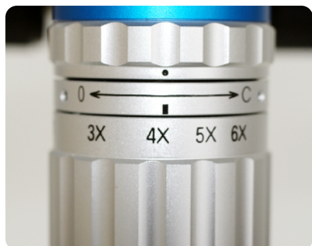
機械絞り(上)ズームリング(下)ズームリングはクリック付