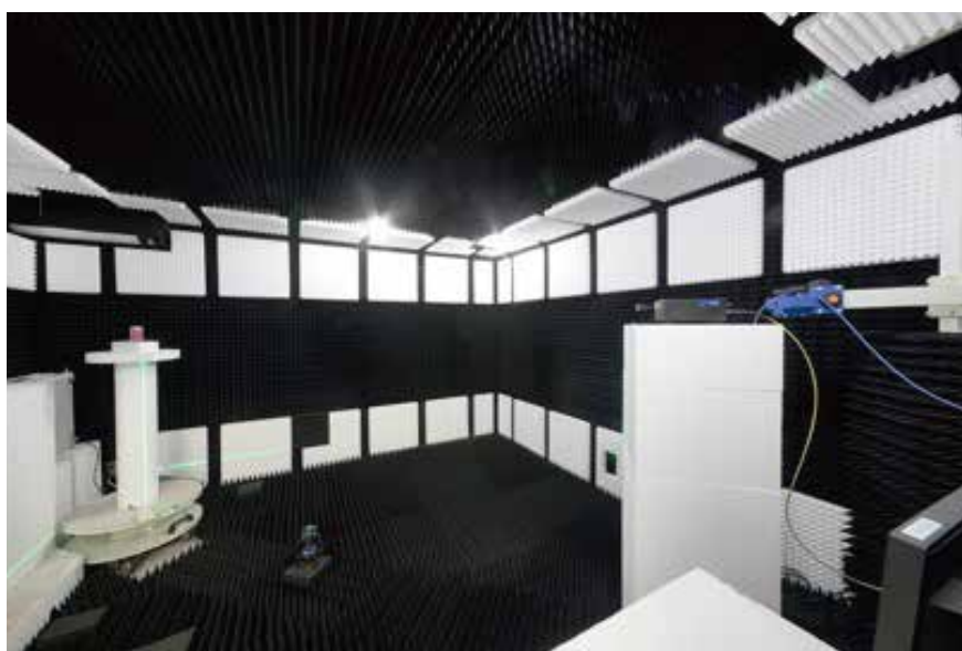
小型アンテナ評価暗室内部