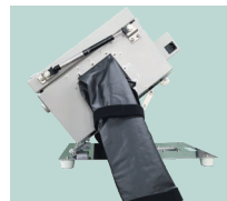
暗箱設置台 固定時(約35°)