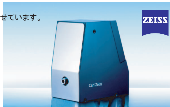
CarlZeiss 社製分光器モジュール CGS