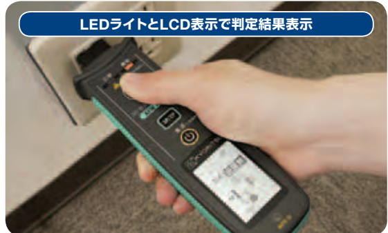
LEDライトとLCD表示で判定結果表示