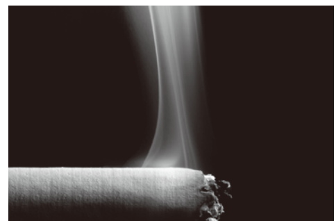
たばこ煙の測定に