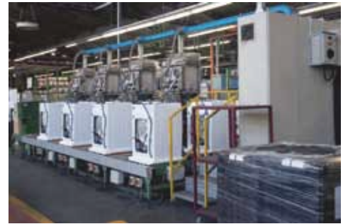
工場内の作業環境測定に