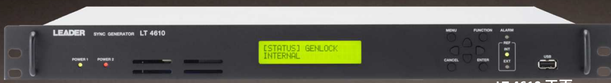
LT 4610 正面