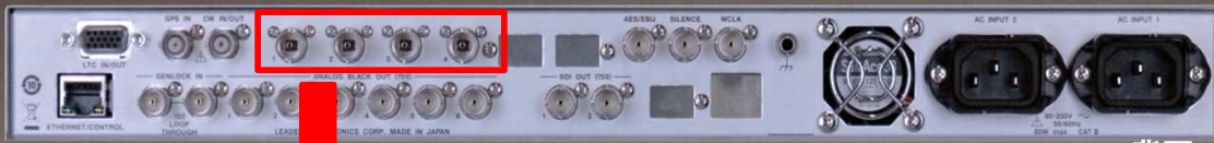
LT 4610 背面